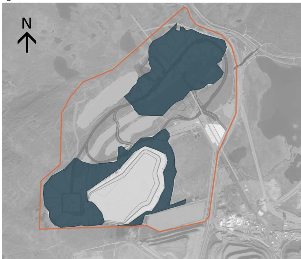
Figur 2. Lokalisering av planerade gråbergsdeponier.

Den slutliga utformningen av gråbergsdeponierna kommer att fastställas framöver och kan skilja sig från vad som redovisas nedan.