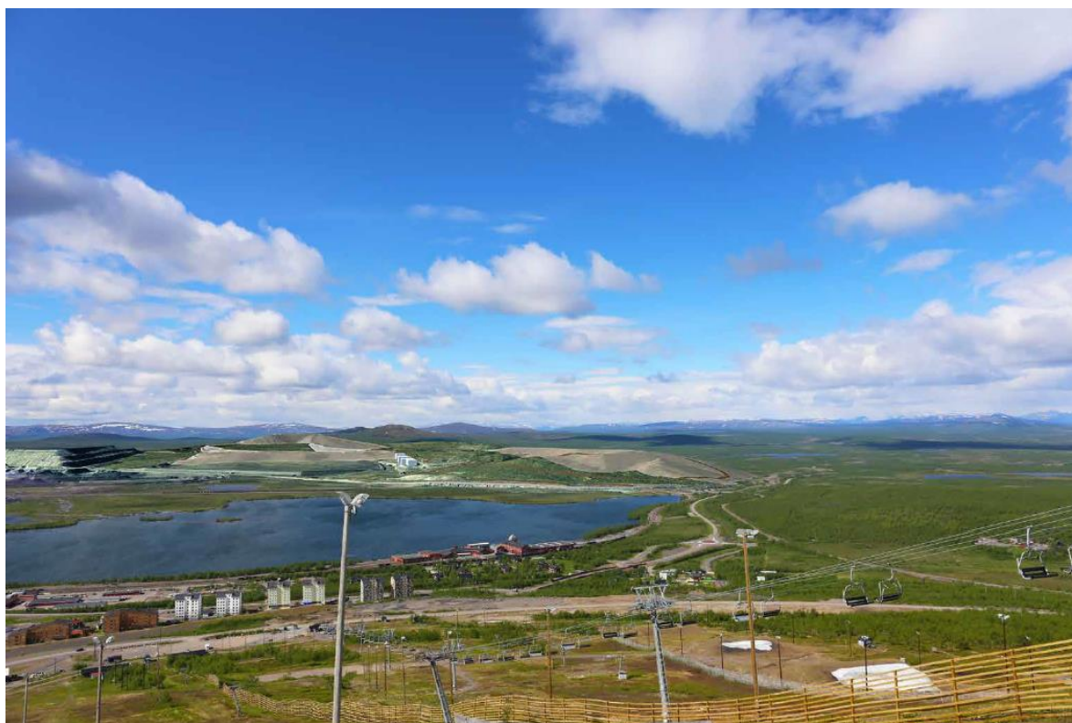
Figur 4. Vy från Luossavaara med visualisering över planerade gråbergsdeponier i förhållande till omgivande verksamheter samt landskap (Copperstone Viscaria - Landscape and visual impact assessment, 2021).