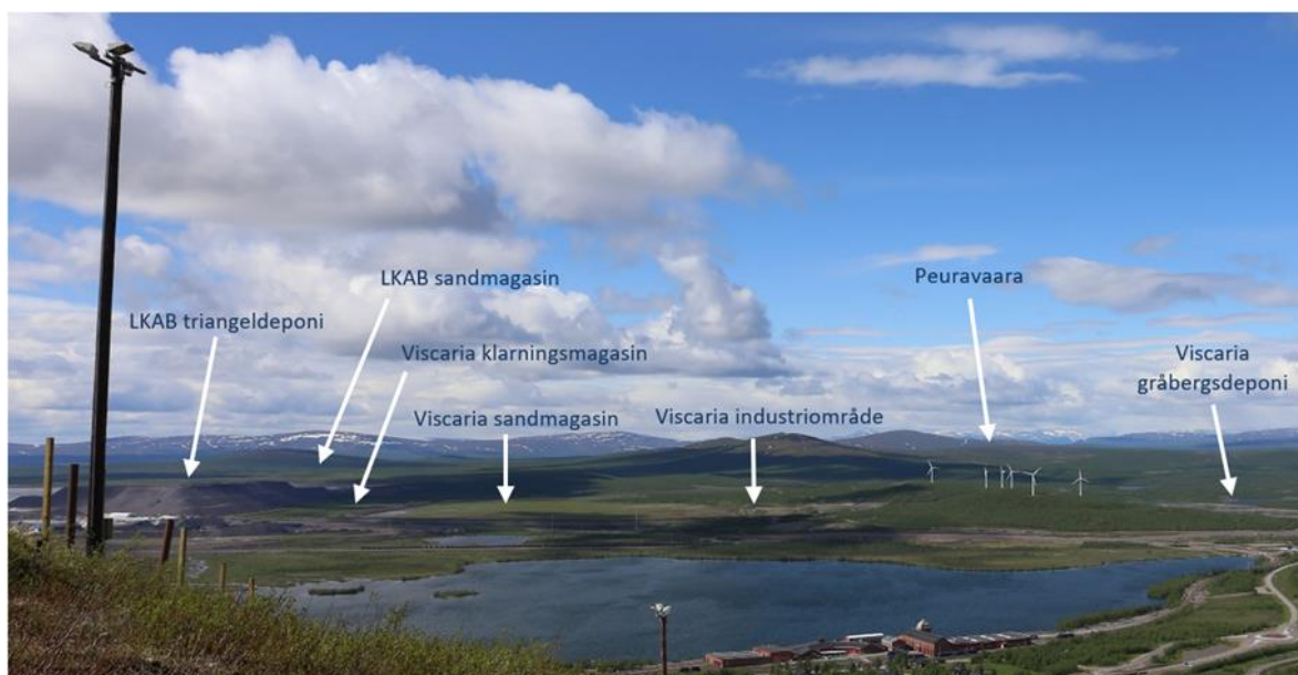
Figur 3. Vy från Luossavaara över befintliga anläggningar vid Viscariaområdet, Kiruna kommun (Foto: Agnes Sandström, Ecogain).

Nedan i Figur 3 redovisas en vy från Luossavaara med befintliga anläggningar och i Figur 4 redovisas en visualisering av planerade gråbergsdeponier i förhållande till omgivningen.